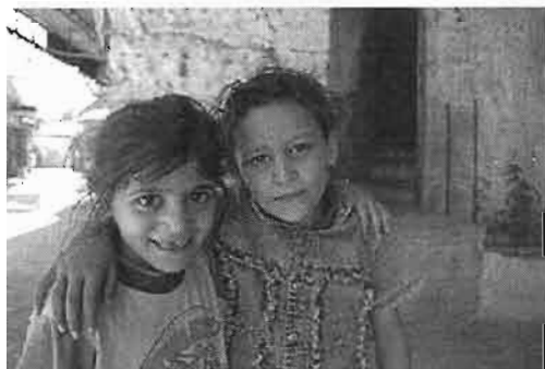
ילדים פלסטינים בחברון

מקורות שונים מציגים מספרים מנוגדים להיקף האוכלוסייה הערבית-פלסטינית. על פי מחקרי אוכלוסייה משנת 2005 התגוררו בשטח בין 1.4 לכ-2.4 מיליון פלסטינים. הנתון הגבוה מגיע מהלשכה הפלסטינית המרכזית לסטטיסטיקה ומתבסס על הערכותיה שלה [9] והנתון הנמוך הוא תוצאת מחקר של מרכז בגין-סאדאת למחקרים אסטרטגיים [10][11]