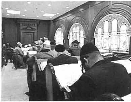
בית המדרש בקבר רחל