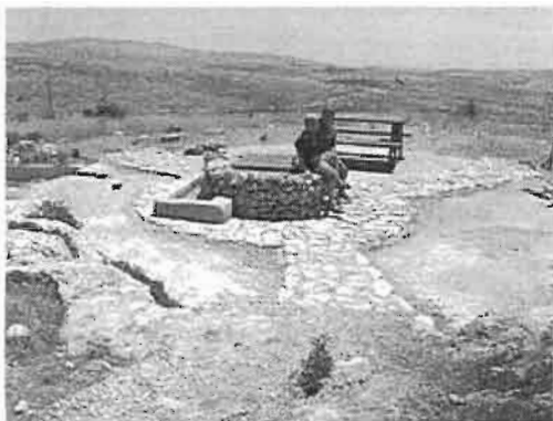
ילדים יהודים במגרון

מקורו של חוסר הוודאות בנוגע לגודל האוכלוסייה הפלסטינית של יהודה ושומרון הוא בהיעדר נתונים המבוססים על מפקד אוכלוסין אמין ומעודכן. המפקד המלא האחרון של האוכלוסייה ביהודה ושומרון נערך ב-1967, ואז נמצא כי באזור נמצאים כ-700,000 ערבים. הנתונים שהתפרסמו מאוחר יותר מבוססים בעיקר על אומדנים והערכות.