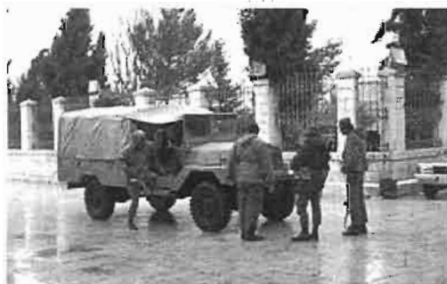
חיילים בבית לחם, 1978

המעמד הנוכחי של שטחי יהודה ושומרון ורצועת עזה נוצר בעקבות מלחמת ששת הימים. בשנים 1967 - 1994 הנהיגה ישראל בכל השטחים שנתפסו במהלך המלחמה שלטון צבאי, על-פי המשפט הבינלאומי המקובל לגבי שטחים שנכבשו במלחמה. עם זאת, מדינת ישראל לא ראתה את עצמה כמדינה כובשת, וטענה כי היא מחילה את המשפט הבינלאומי על האזור מתוך רצון טוב ולא מתוך חובה. אף על-פי שישאל לא הכירה באופן רשמי בסיפוח "הגדה המערבית" לירדן כמו גם שום מדינה בעולם למעט בריטניה ופקיסטן היא כיבדה את הסטטוס-קוו המשפטי שנוצר, והמשיכה להחיל את החוק הירדני באזור. עם זאת, רצועת עזה לא סופחה מעולם למצרים, ולכן המצב המשפטי בה היה מורכב יותר. כמו כן, חלק מחוקי מדינת ישראל מכילים עצמם על שטחי יהודה ושומרון ורצועת עזה.