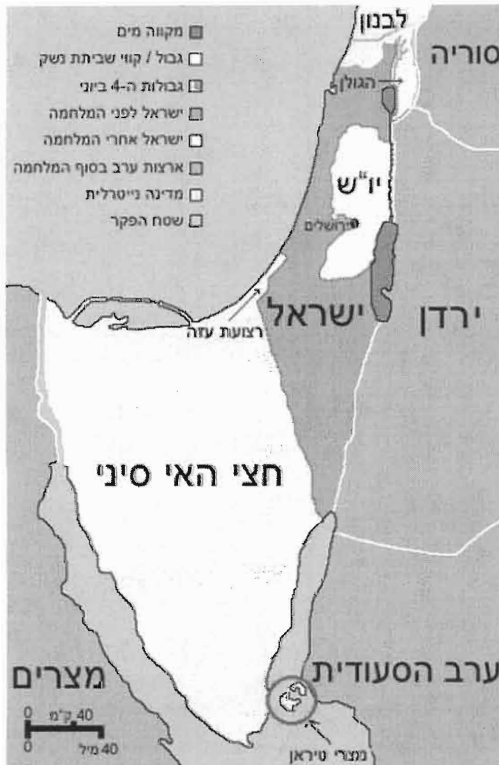
מפת השטחים שהיו בשליטת ישראל בסוף מלחמת ששת הימים